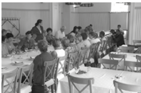
2011. Csongrád Megyei Honismereti Egyesület Kiszomboron