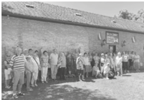
Ásotthalmon a Rózsa Sándor Élményház előtt