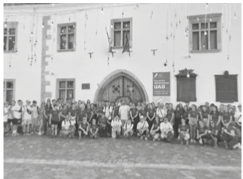
A táborozók Mátyás király szülőháza előtt