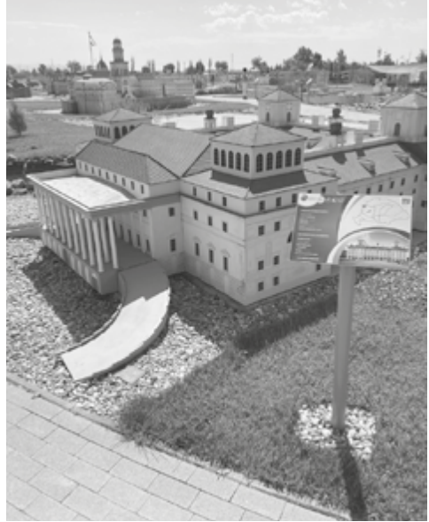
Mórahalom, Ezer Év Parkja