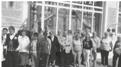
Az avatók az emléktábla előtt