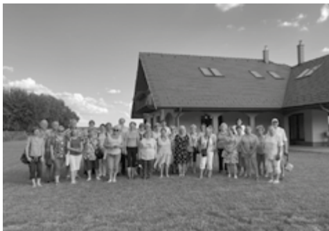
Az öttömösi Bálint Vendégházban