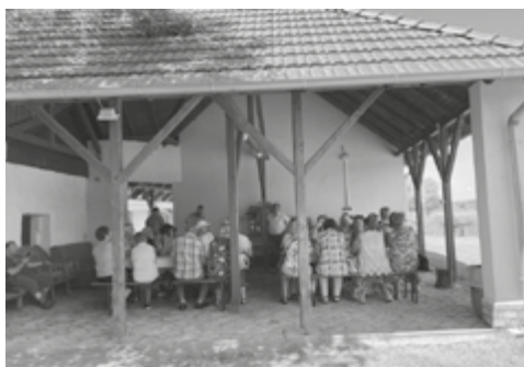
Ásotthalmon a Tóth Pincészetben