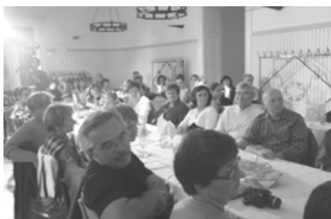
A Kör tagjai

2016-ban a Makón rendezett Országos Honismereti Akadémia támogatásában a honismereti kör is részt vett. Ezen a napon az egyik szervezett kirándulás alkalmával megnézték a község nevezetességeit, így a Rotundát és a Rónay-kastélyt, majd a közös vacsorára a kör asszonyai kemencében sültött buktával is kedveskedtek.