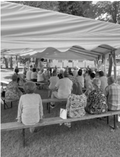
Öttömösön spárgás ételeket kóstolhattunk