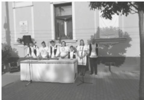
Dorozsmai Búzakalász Citerazenekar