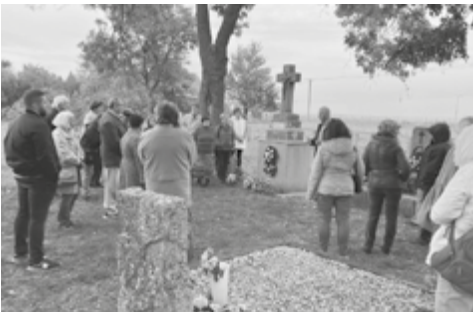
Térvár, Temető a határkerítés előtt