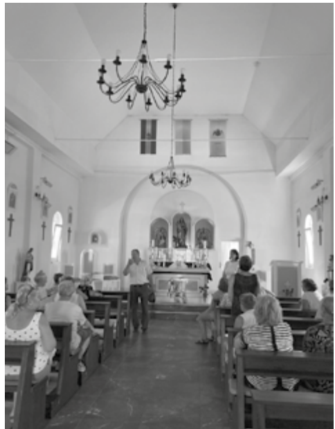
Az öttömösi templomban