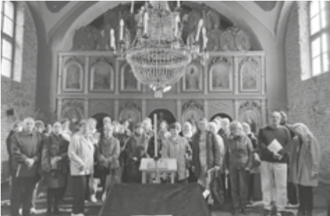
Deszk, Szerb templomban