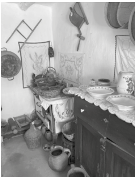
Megnéztük a Gátsori Tanyamúzeum helyiségeit