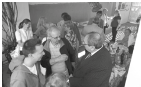
Kocsis család Pitvarosról