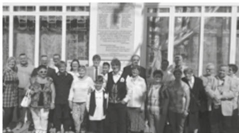
Az emléktábla avatói