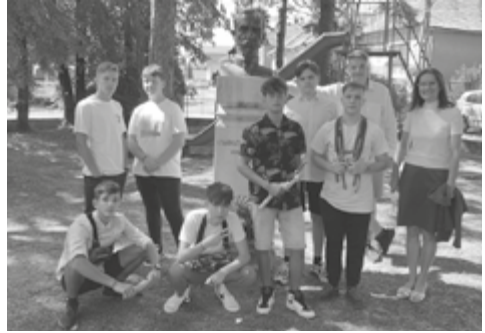
A szegedi csapat