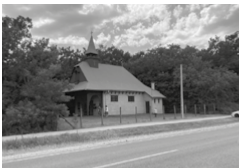
Back Kápolna, Ásotthalom