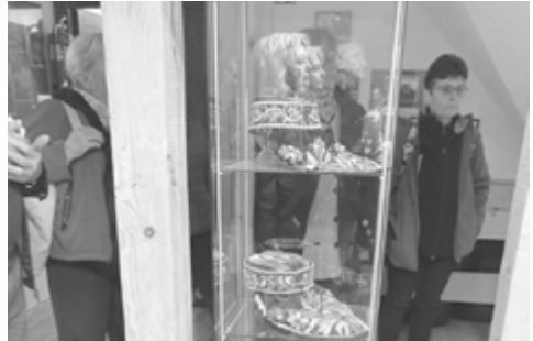
Deszk, Szerb gyűjteményben