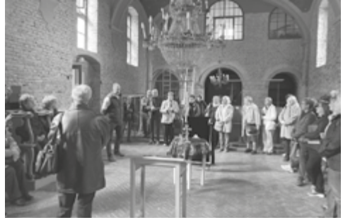
Deszk, Szerb templomban