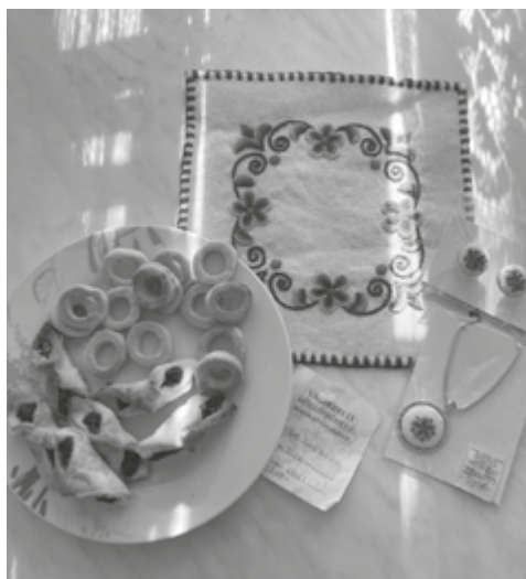
Barátfüle, sós percek, szőrhímzés